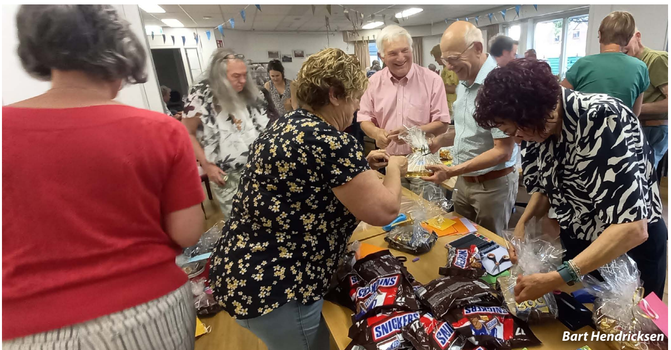
De deelnemers stelden pakketjes met een zomergroet namens de kerken samen.

Na het gesprek gingen de deelnemers daadwerkelijk samen iets doen. Er werden pakketjes met een zomergroet namens de kerken samengesteld. Pakketjes met iets lekkers, een boeken- en tijdschriftenbon en een spelletje. Deze pakketjes werden een paar dagen na de bijeenkomst uitgedeeld aan alle cliënten van de Voedselbank in Montferland. Ook konden mensen zelf een pakketje meenemen en geven aan iemand die wel wat aandacht kon gebruiken. Het werd een gezellige, georganiseerde chaos, waarbij iedereen iets kon doen. Deze Sta op tegen armoede-bijeenkomst werd georganiseerd door alle kerken van Montferland. Veel deelnemers keken positief op de avond terug: 'inspirerend', 'verbindend' en 'mooi om samen iets te doen'. Op naar de volgende editie!