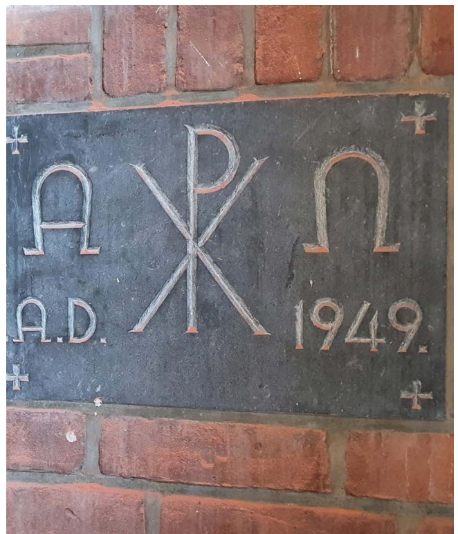
Steen kapel: In de nieuwe kapel wordt een gedenksteen uit de oude Mariakapel weer teruggeplaatst.